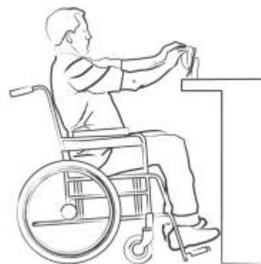
Placering af betalingsterminal, der anvendes af kørestolsbruger

Mennesker med fysiske handicap er muligvis ikke i stand til at anvende betalingsterminalen grundet højden på installationen, trin der fører til installationen, rækkeafstanden over disken eller andre fysiske barrierer. Placeringen og monteringen af betalingsterminalen bør derfor imødekomme dette.