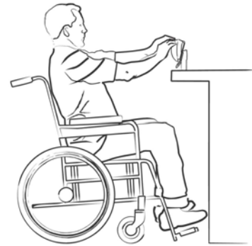
Positionierung des PIN-Pads am Kassentisch für behinderte Benutzer

Menschen mit körperlichen Behinderungen können unter Umständen das PIN-Pad oder den Kartenleser nicht erreichen, da sie sich weniger hoch über dem Boden befinden, eventuelle Stufen zum Kassentisch überwunden werden müssen, sie nicht über die entsprechende Reichweite über den Kassentisch verfügen oder andere physische Hindernisse bestehen. Die Positionierung und Befestigung des PIN-Pads muß dies berücksichtigen.