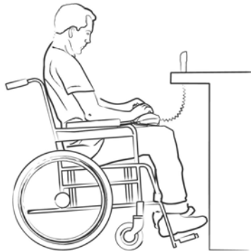
Behinderter Bediener mit herausgenommenem PIN-Pad

Um allen verschiedenen Benutzern gerecht zu werden sollte das PIN-Pad bevorzugt auf einer verstellbaren Halterung montiert werden, damit die passende Höhe und der bevorzugte Winkel vom Bediener eingestellt werden können.